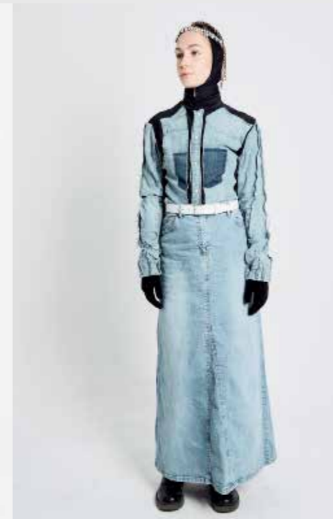
Les reines Marie et Marguerite.